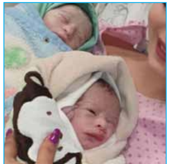
احدى الامهات الولادات مع توائمها