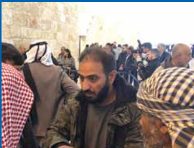
في المحكمة امس الاول