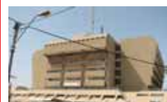
قسم الولادة في مستشفى الكرمل، وأجرى حديثا

بعد ان داهمت بناية المجلس المحلي الشرطة تفرج عن 4 اشخاص من طرعان حقت معهم بشبهة تجاوزات مالية